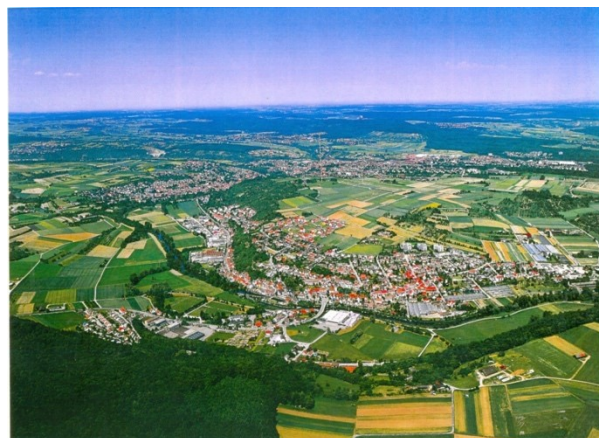
Luftaufnahme Lomersheim von Süden

Der Dreißigjährige Krieg hatte auch dem mehrfach niedergebrannten Dorf Lomersheim stark zugesetzt. Nur wenige Einwohner überlebten ihn. Der mächtige Bergfried der Lomersheimer Burg wurde während des Pfälzischen Erbfolgekrieges in die Eppinger Linien einbezogen und trutzte bis 1815 der Zeit. Der ursprünglich 30 Meter hohe und 7 Meter breite Turm wurde, mit amtlicher Genehmigung, von einem Maurermeister zum Zwecke der Bruchsteingewinnung zum Einstürzen gebracht. Allerdings hielten die Trümmer aus mittelalterlichem „Beton“ so gut zusammen, dass die großen Turmbrocken noch heute in der einstigen Burganlage als Lomersheimer „Turmschdombe“ zu besichtigen sind.