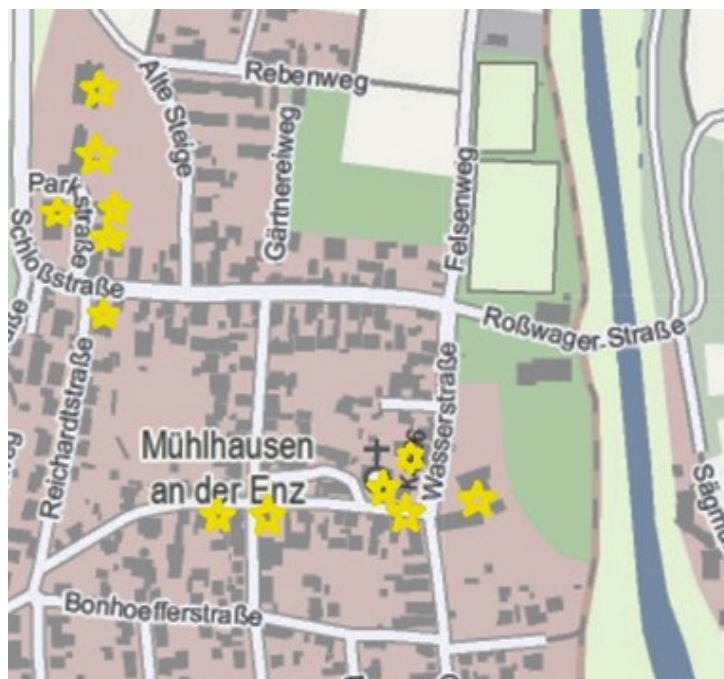
Objekte mit Floßholzspuren