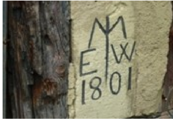
Datumsangabe am Westgiebel

Nicht wegen der Floßholzspuren ist das Gebäude so interessant. Es zeichnet sich durch ein sehr gut erhaltenes Fachwerk aus. An ihm lassen sich eine Vielzahl von Markierungen der Holzkonstruktion erkennen, quasi der gesamte Ablauf des Abzimmerns ist nachvollziehbar. Ob das am Westgiebel dargestellte Datum auch die Entstehung des Gebäudes bezeugt oder ob sich nur einer der Eigentümer verewigt hat, kann nicht nachgewiesen werden. Es lohnt sich einmal einige Zeit an dem Gebäude zu verweilen, die Kennzeichnung der einzelnen Konstruktionshölzer lässt sich nach einer genaueren Betrachtung gut verstehen. Leider wird der Blick auf den guten Zustand der Fassade durch einige davor aufgestellte Schaltschränke ein wenig gestört.