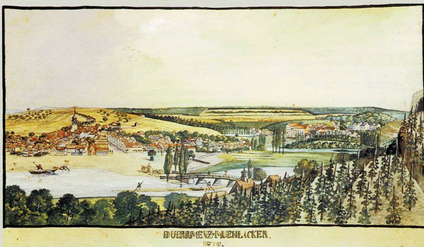
Flößer auf der Enz bei Dürrmenz, 1870.

Auf Spurensuche nach verbautem Floßholz aus dem Schwarzwald. Teil 1 der Dokumentation des Schwäbischen Heimatbundes, Regionalgruppe Stromberg – Mittlere Enz, Maulbronn