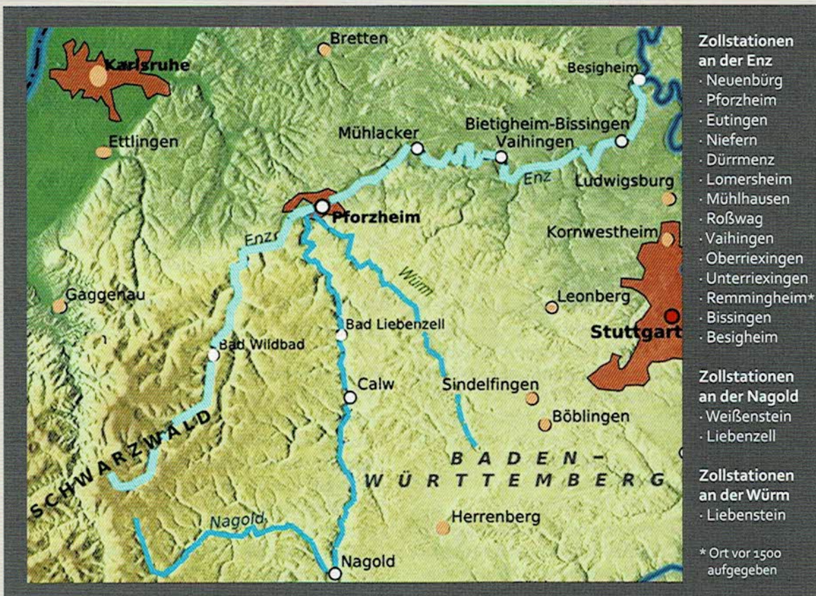
Die Enz mit ihren Nebenflüssen Nagold und Würm.

Eine zunehmende Zahl an Floßholzdetectiven entdeckte die Liebe zu Fachwerkhäusern und Kirchen. In einer über 200 Seiten umfassenden Dokumentation wurden die Floßholzspuren gesammelt. Auszüge daraus sollen in einer losen Folge in der „RMR aktuell“ veröffentlicht werden. Analog zum gleichen Thema im Raum Mittlerer Neckar will Tilmann Marstaller eine wissenschaftliche Auswertung folgen lassen.