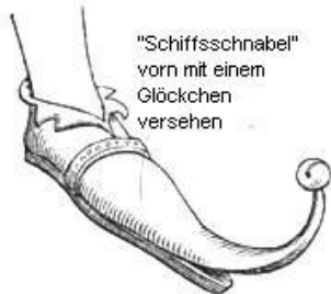
"Schiffsschnabel" vorn mit einem Glöckchen versehen

ab dem 15. Jahrhundert besondere Unterschuhe oder Trippen, die aus Holz mit einem Überzug von Leder, genau nach der Form der Sohle, zur Unterstützung der Schnabel langspitzig gestaltet und zu ihrer Befestigung mit Spanriemen versehen waren