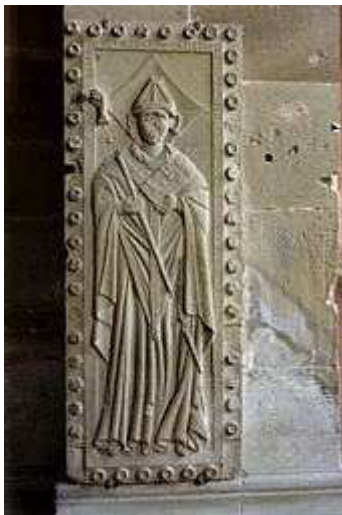
Grabplatte des Bischofs im Kloster Maulbronn

Ulrich von Dürrmenz (auch Ulrich I. von Speyer ) († 26. Dezember 1163 in Maulbronn , beigesetzt im Kloster Maulbronn) war Reichskanzler unter Kaiser Friedrich I. und erwählter Bischof von Speyer .